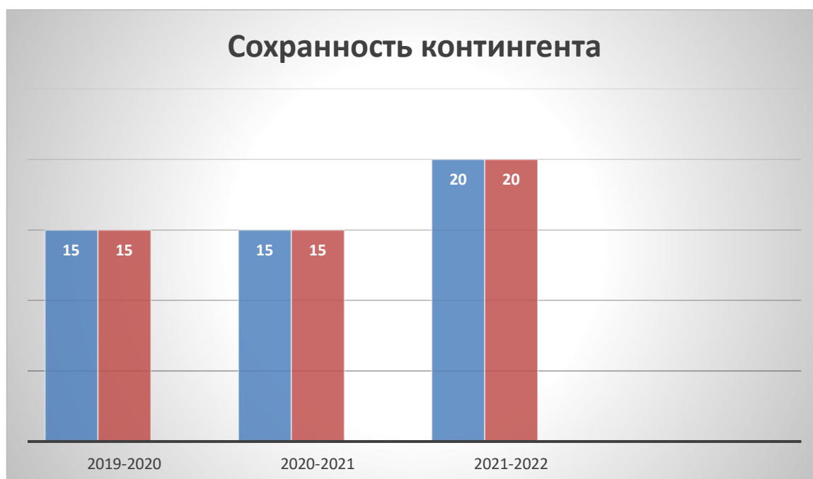
Диаграмма динамики численности обучающихся на начало и конец учебных годов