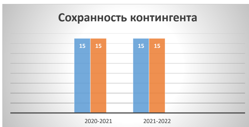
Диаграмма динамики численности обучающихся на начало и конец учебных годов

Из диаграммы видно, что сохранность контингента обучающихся на протяжении 2 лет является 100%.