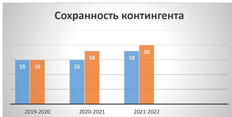
Диаграмма динамики численности обучающихся на начало и конец учебных годов